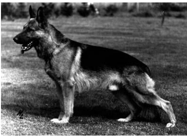
Canto v.d. Wienerau

Canto v.d. Wienerau er indavlet 5-4 på Hein Richterbach, Axel v. Deiningshauserheide 5,5-5,5 og Rolf v. Osnabrücker Land Rolf-Ina 5-5.