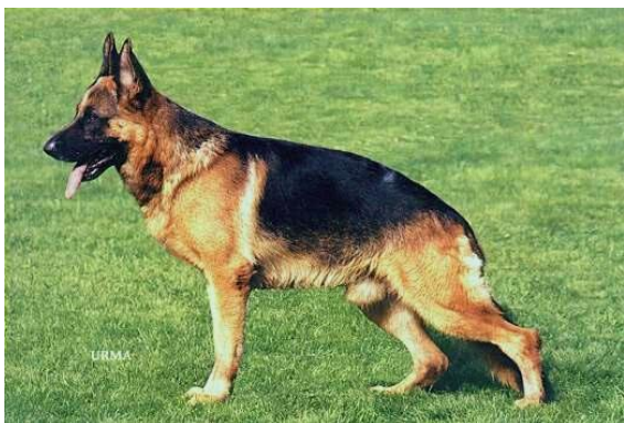
Visum v. Arminius

Jeck Noricum fik en søn som Sieger i 1996, det var Visum v. Arminius. Denne linie er videreført over Max della Loggia dei Mercanti, videre til Dux della Valcuvia, Quantum v. Arminius til Sieger 2006 Zamp v. Thermodos.