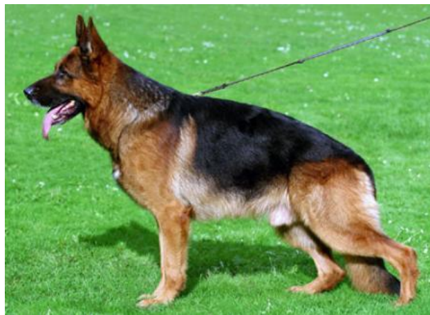
Larus v. Batu

Ursus v. Batu har videreført siegerlinien til Sieger 2001 og 2002 Yasko v. Farbenspiel denne har igen ført linien videre til Sieger 2004 og 2005 Larus v. Batu.