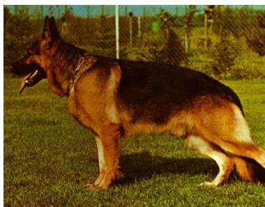
Quanto v.d. Wienerau

Mutz v.d. Pelztierfarm linien fik en ny æra i 2011 da Remo v. Fichtenschlag blev Sieger.