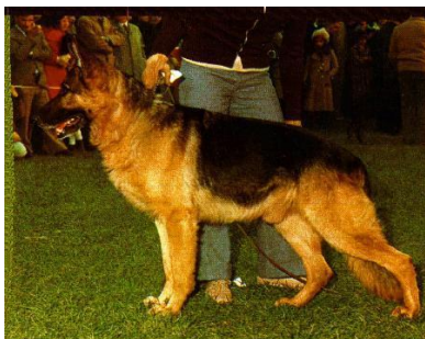
Mutz v.d. Pelztierfarm

Mutz v.d. Pelztierfarm er indavlet 3-3 på Regina v. Colonia Agrippina.