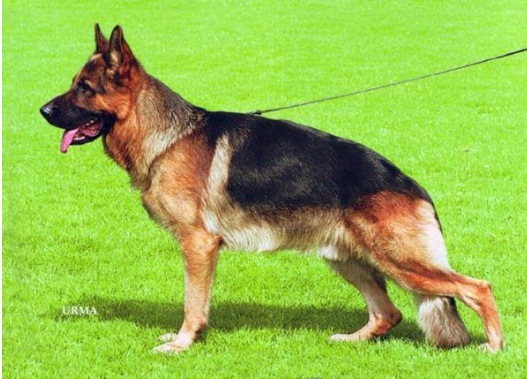
Ursus v. Batu

Jeck v. Noricums linie er også ført videre over Hobby v. Gletschertopf til Sieger 2000 Ursus v. Batu