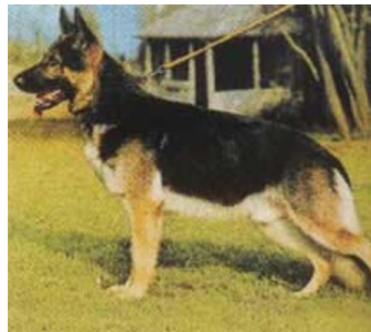
Marko v. Cellerland