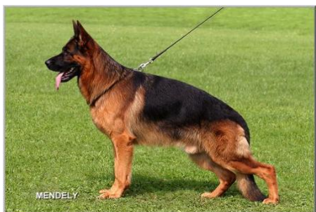
Ober v. Bad-Boll

Linien over Sieger Visum v. Arminius fortsætter over Max della Loggia dei Mercanti, Dux della Valcuvia, Quantum v. Arminius Giovanni v. Kapellenberg til Sieger 2010 Ober v. Bad-Boll, hvis mor er Aike zum Gigelsfelsen en datter af Kevin Murrthal.