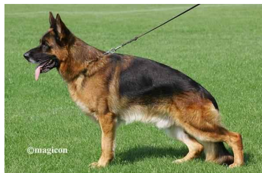
Vegas du Haut Mansard