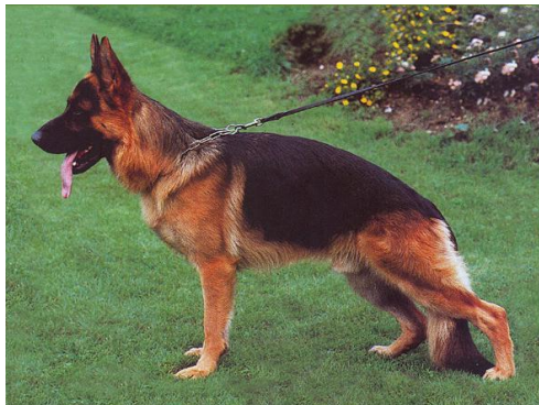
Lasso v. Neuen Berg.

Mark v. Haus Beck fik en god søn i dansk opdrættet Folemarkens Jasso som blev fader til Sieger 1997 Lasso v. Neuen Berg. Således fik Canto v.d. Wienerau en fortsættelse af sin faderlinie.