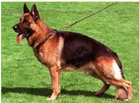
Kimon v. Dan Alhedy, s Hoeve

Den måske bedste linie fra Canto v.d. Wienerau er over Frei v. Holtkämper See, Zorro v. Haus Beck, Lasso Wiedenbrücker Land, Fedor Arminius og Mark v. Haus Beck til Sieger 1994 Kimon v. Dan Alhedy, s Hoeve.