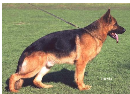
Bax v. Luisenstrasse