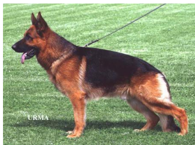
Yasko v. Farbenspiel