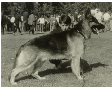
Arras v. Haus Helma f. 25.02.1967 SZ 1131467

I linie 2 efter Brando Tappenort, Fredo Gellerhon, Tom v. Haus Solms derefter Sieger 1971 Arras v. Haus Helma