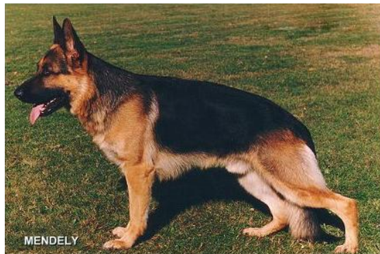
Sieger 1990 - 1991 f. 13.03 1986 SZ 1668730

Alf Waldorf Emst har også sønnen AslanMaiweg, videre til Fix Sieben Faulen herefter fortsætter linien til Hein Königsbruch, Canto v.d. Wienerau til Sieger 1978 Canto Arminius, Sonny Badener Land, Tell Grossen Sand, til Sieger 1990-1991 Fanto Hirschel.