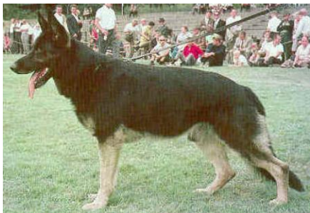
Bodo v. Lierberg f. 16.03.1962 SZ 1026137

I linien efter Yasko Tiede kom Lex Dreikinder og den store nedarver Vello Sieben Faulen, herefter Sieger Bodo v. Lierberg.