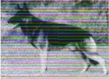
Xando v. Karthago Sieger 1990