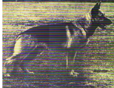
Drigon Fuhrmannshof Sieger 1976