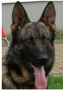
Caro v. Mörfelder Land Sieger 2006