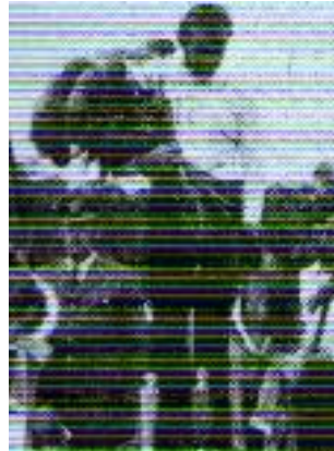
Cerry v. Dürener Land Sieger 1975