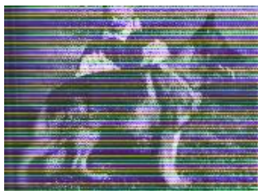
Okar v. Karthago Sieger 1993