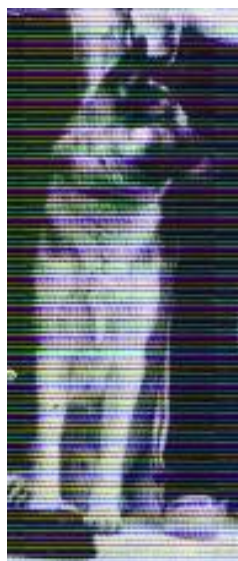
Aco v. Burg Esch Sieger 1986