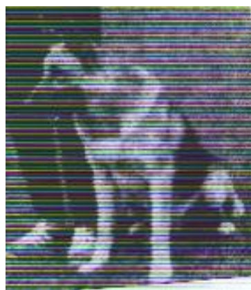
Drago Sieger 1970