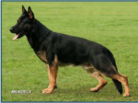
Falko v. Wolfsblick Sieger 2007