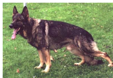
Anosch v. Adelmansfelder Land Sieger 2002