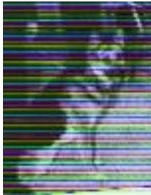
Black v. Unteren Wallberg Sieger 1965