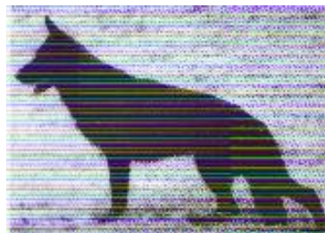
Blacky v. Neuen Lande Sieger 1992