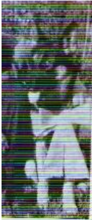
Betty v. Bonsdorf Sieger 1968 – 1972