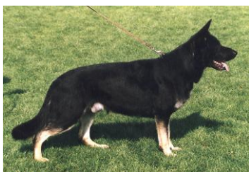
Bastin v. Kokeltal Sieger 2001