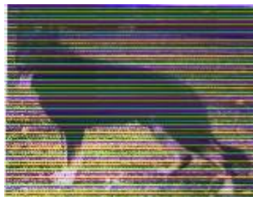
Gotthilf v. d. Kine Sieger 1994