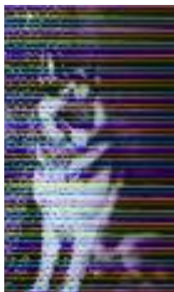
Baldur v. Ostertal Sieger 1956 – 1959