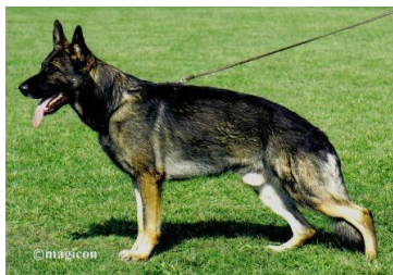
Javir Talka Marda Sieger 2008