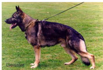
Iriac. Ruhbachtal Sieger 1999