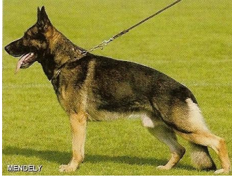
Ellex v. Salztalblick Sieger 2005