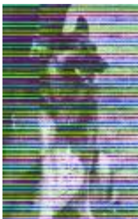
Bingo Ritzerbachtal Sieger 1964 – 1966 – 1967