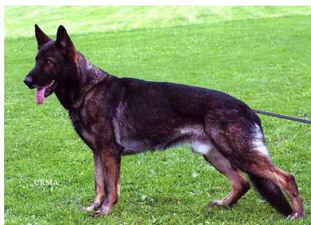
Ernst v. Weinbergblick Sieger 2000