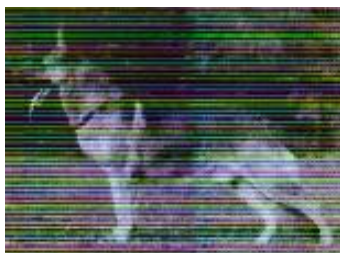
Fang Stahlhammer Sieger 1969