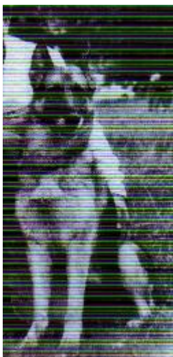
Bona v. Waldwinkel Sieger 1987