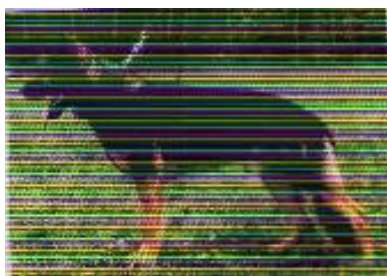
Agbar Bethme Sieger 1995