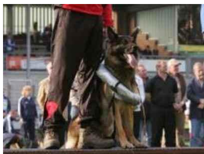
Eric v. Sportpark Sieger 2009