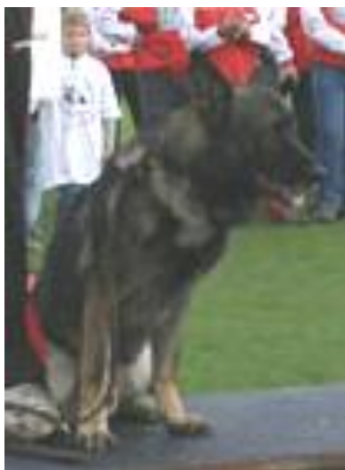
Falco v. Guldenen Winkel Sieger 2004