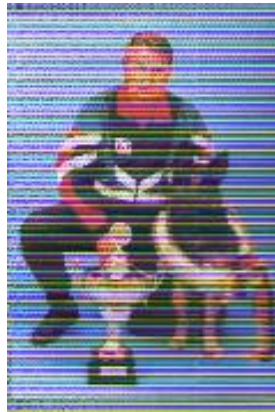
Quaid v.d. Hegewiese Sieger 1997