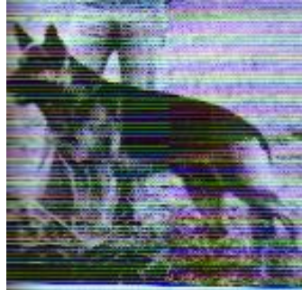
Vargo v. Seebachtal Sieger 1979