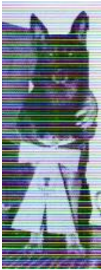
Arko v. Riedersknapp Sieger 1958 -1960