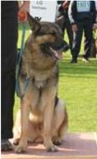
Attaque v.d. Adelegg Sieger 2003