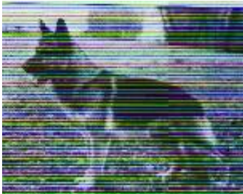
Racker v. Itztal Sieger 1971