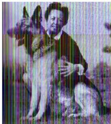
Anderl v. Weissblauen Fåahnlein Sieger 1962