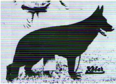
Boy v. Grawenhof Sieger 1981